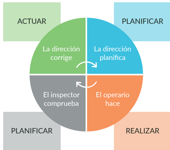
Ciclo PDCA bajo el paraguas de una adecuada política en materia de salud y bienestar.

Los cambios deben realizarse paulatinamente, disponiendo de los recursos necesarios (humanos, económicos, materiales y temporales) y contando con la implicación de todos los niveles jerárquicos presentes en la empresa, con especial hincapié en los mandos intermedios.